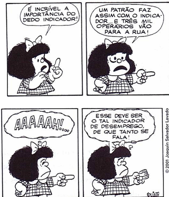
QUINO. Toda Mafalda. São Paulo: Martins Fontes, 2001.

a) Indique a oração que apresenta a ordem inversa de sujeito e predicado: