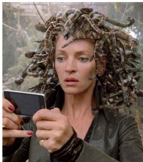
Medusa do filme Percy Jackson .