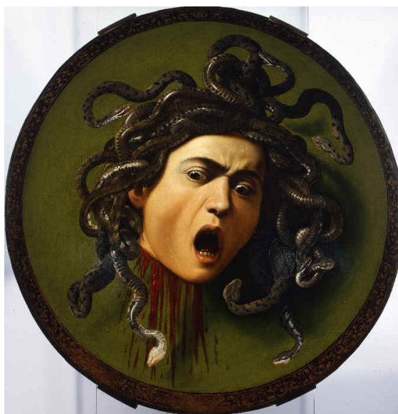
Cabeça de Medusa , de Caravaggio.

Caravaggio é o mais importante pintor relacionado ao Barroco de Roma. O modo revolucionário de usar a luz criada intencionalmente pelo artista para dirigir a atenção do observador para a cena e a dramaticidade observada nos rostos dos personagens são características marcantes.