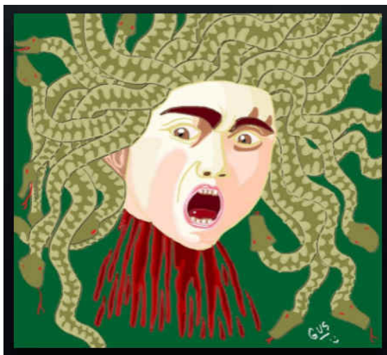
Medusa, by Guspo.