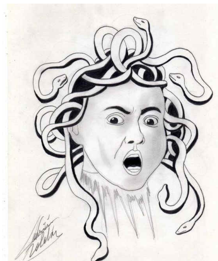
Medusa, de Jewelry.