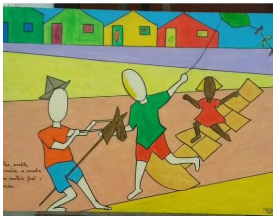
Tela retrata brincadeiras do passado

6. Na imagem a seguir, é possível perceber algumas crianças brincando.