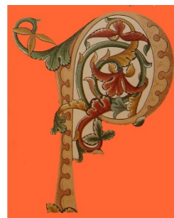
Letra capitular “P”, iluminura, século XIV.