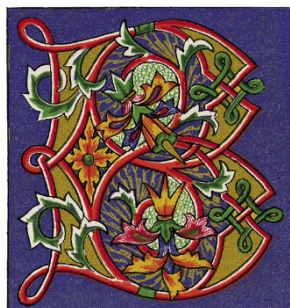
Letra capitular “B”, iluminura, século XIV.

A letra inicial do parágrafo ou do capítulo tinha tamanho maior do que o restante do texto e era decorada com arabescos, ramagens, flores ou ilustrações de cenas em miniaturas. Era chamada de letra capitular ou letra capital – termo ainda empregado na impressão de livros. Veja, abaixo, alguns exemplos de capitulares em manuscritos medievais: