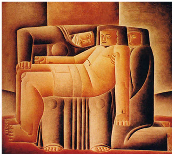
Figura 2. Pietà , Vicente do Rego Monteiro

2. Considerando estudos sobre Composição visual e seus elementos formais, observe atentamente a figura 2 e marque o item que apresenta corretamente o ritmo e a forma predominantes na composição.