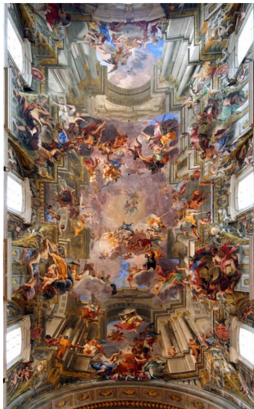
Figura 2. Apotheose de Santo Inácio , Andrea Pozzo – Pintura do teto da igreja de Santo Inácio de Loyola – Roma.