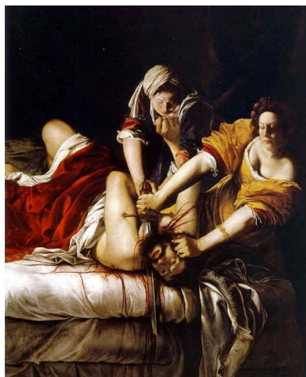
Figura 5. Judite ao matar Holofernes , Artemisia Gentileschi, 1612/21.

As figuras referendam a realidade do Barroco europeu, a partir de seus aspectos formais marque o item correto.