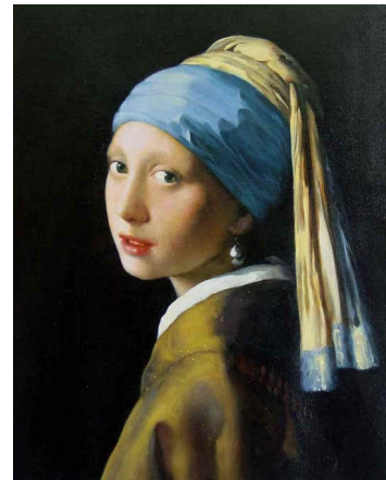
Figura 4. A moça com o brinco de pérolas , Johannes Vermeer.

6. Considere as figuras 1 e 3 para resolução desta questão.