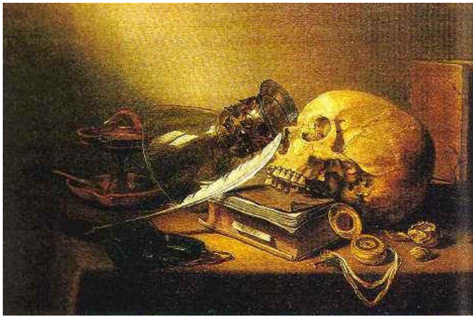
Figura 3. Vanitas , Pieter Claesz, 1645.