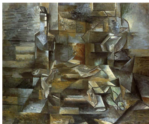
Figura 1. Georges Braque, Garrafas e Pescados, 1910/12.