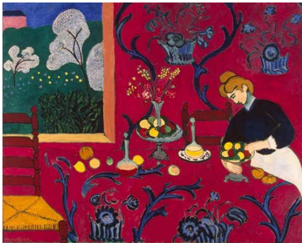
Figura 3. Henri Matisse, Harmonia em Vermelho, 1908