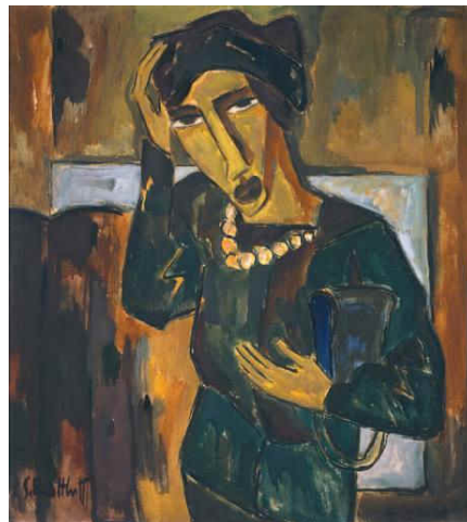
Figura 4. Karl Schmidt-Rottluff, Mulher com Bolsa, 1915.

Os aspectos visuais apresentadas na figura 3 são contraditórios aos que se identificam como arte conservadora, o nome que identifica essa tendência artística justifica sua aparência e conseqüentemente a ação de seus promotores. Faça breve comentário acerca dessa arte em relação ao título que a identifica " Fauvismo ".