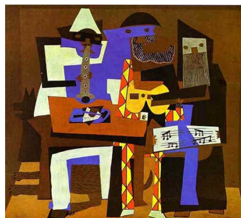
Figura 2. Pablo Picasso, Os Três Músicos, 1921.